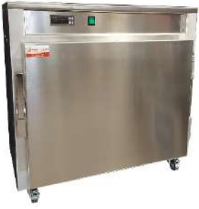
Etuve Cocktail 5 niveaux GN1/1 ou 600 x 400