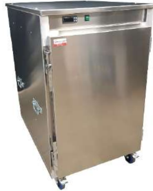
Etuve Senior 10 niveaux GN2/1 ou 600 x 800 mm