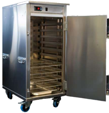
Etuve Junior 10 niveaux GN1/1 ou 600 x 400 mm