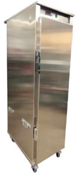
Etuve Haute 17 niveaux GN1/1 ou 600 x 400

Nos quatre modèles d'étuves sont conçus et fabriqués en France dans nos ateliers à Saint-Romain-la-Motte (42).