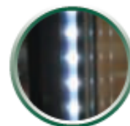
contour de porte lumineux