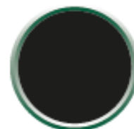
Extérieur laqué noir