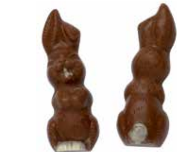
LAPIN RIEUR 2 empreintes pour 1 lapin.