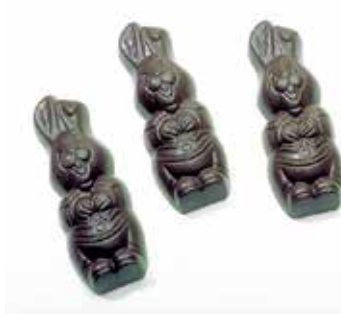
FRITURE LAPINS RIEURS 16 empreintes. 11 g.