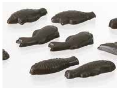
FRITURE POISSONS 30 EMPREINTES 4 g.