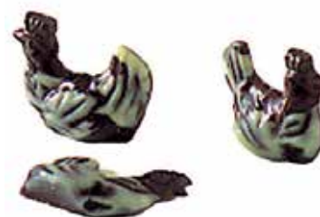
FRITURE POULES COUVEUSES 10 g.