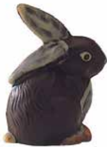
LAPIN 2 empreintes pour 1 lapin.