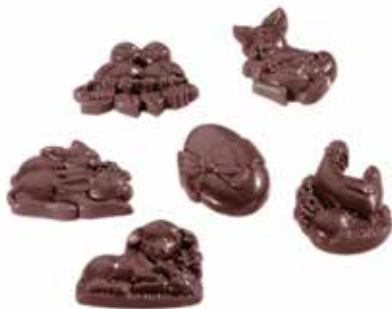
FRITURE 18 SUJETS 18 empreintes. 6 figurines assorties. 6 g.