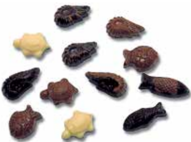
FRITURE 35 EMPREINTES 4,5 g. Poissons, crevettes et tortues.