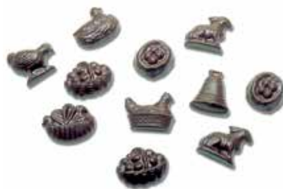
FRITURE PÂQUES 32 EMPREINTES 5 g.