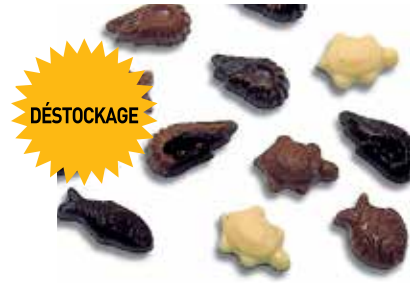
FRITURES PÂQUES 12 plaques souples en PVC. 42 empreintes.