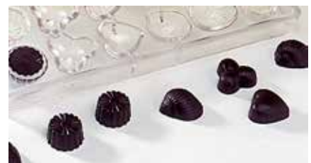
ASSORTIMENTS Coquilles, Œufs, escargots, ronds striés... 24 empreintes.