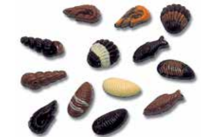
FRITURE FRUITS DE MER 20 EMPREINTES 6-9 g. Coquilles, poissons, crevettes, escargots, moules.